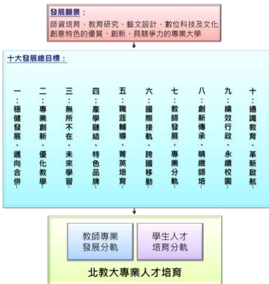
圖 1 校務發展中長程計畫架構圖

本校教育績效目標是以校務發展中長程計畫之十大發展總目標為立基，以下茲就每一發展總目標之「現況」、「目標」、「策略」、「行動方案」分別論述之，每一發展總目標亦須由本校各學術暨行政單位內合作以及單位間橫向協調，方能成就。